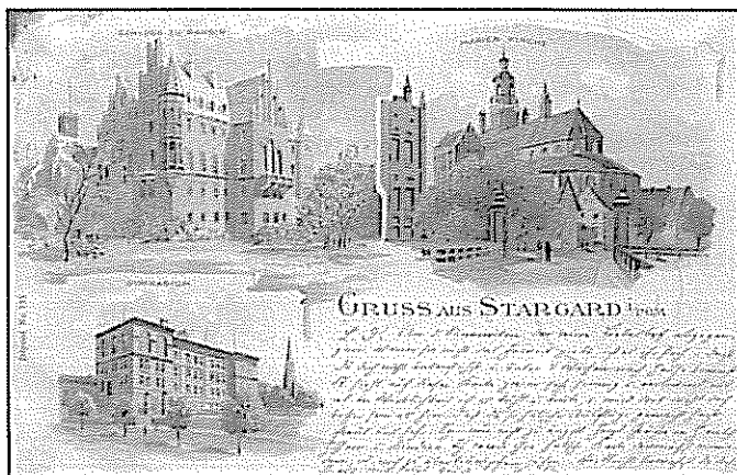
Il. 1. Pocztówka, Gruss aus Stargard i. Pom. , chromolitografia, 1898; sygn. MS/H/903